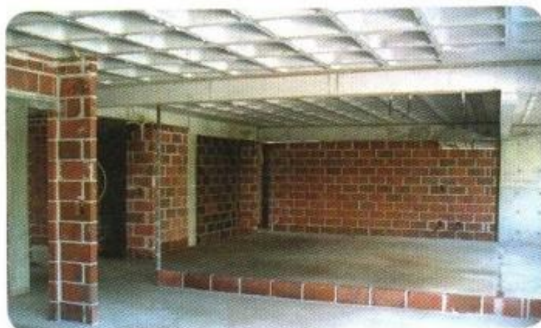
• Prédios de alto padrão em construção, em João Pessoa e Recife, com alvenaria racionalizada, tem paredes alinhadas e o local de trabalho limpo